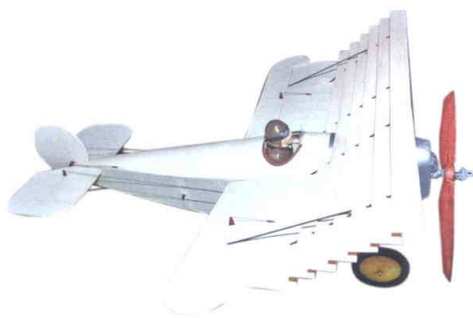
▲ Mnohoplošný, pochopitelně nelétající Avro Vladimíra Alferyho

výšku ve stoupáku a letěl opět maximum. Třetí let byl zpočátku jakoby kopií toho prvního, ale po skončení motoru asi zůstal velký uzel na svazku vzadu a v kluzu Mig nehezky houpal, do maxima chyběly 2 sec.